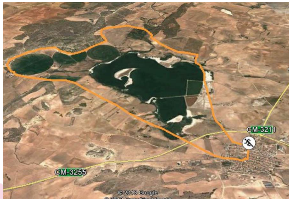
MAPA DE LA PRUEBA