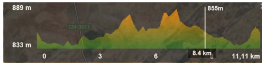
PERFIL DE LA PRUEBA