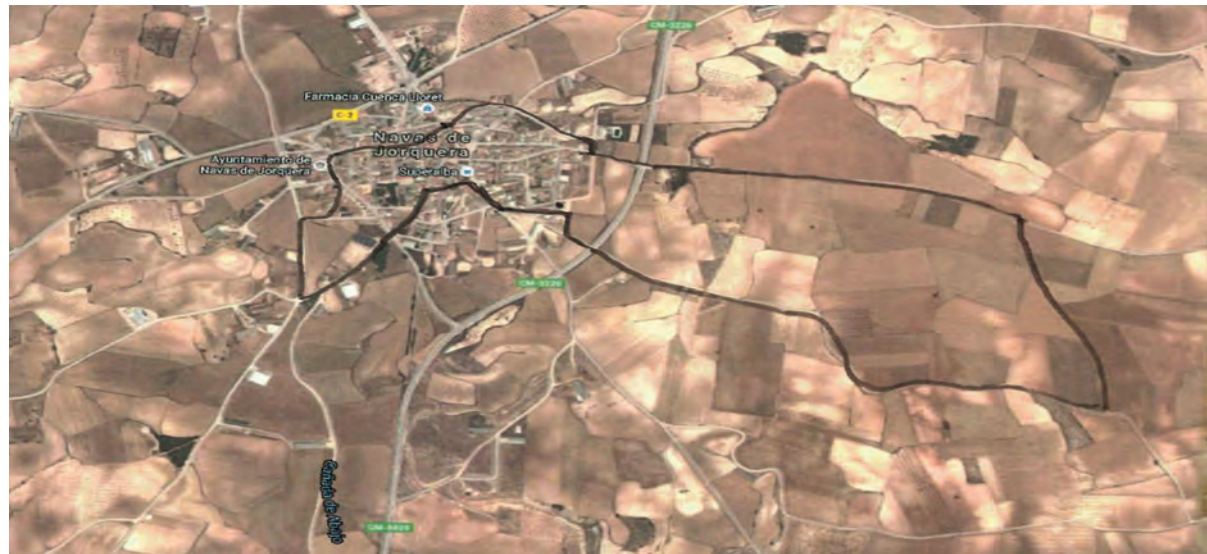
MAPA DE LA PRUEBA